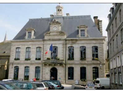
L'hôtel de ville est concerné par la question des mises aux normes.

Ces dernières années, la Ville consacrait près de 3M€ par an aux travaux d'entretien et de renouvellement. Pour rénover durablement le patrimoine, la Ville met en place un plan pluriannuel d'entretien et affectera à ce PPE 6 M€ à 7 M€ par an. La montée en charge sera progressive, sur deux années, les services devant aussi s'organiser pour y répondre. A terme, quand le patrimoine sera renouvelé et bien entretenu, des économies d'échelle sont attendues. Surtout, la ville offrira un visage plus souriant.