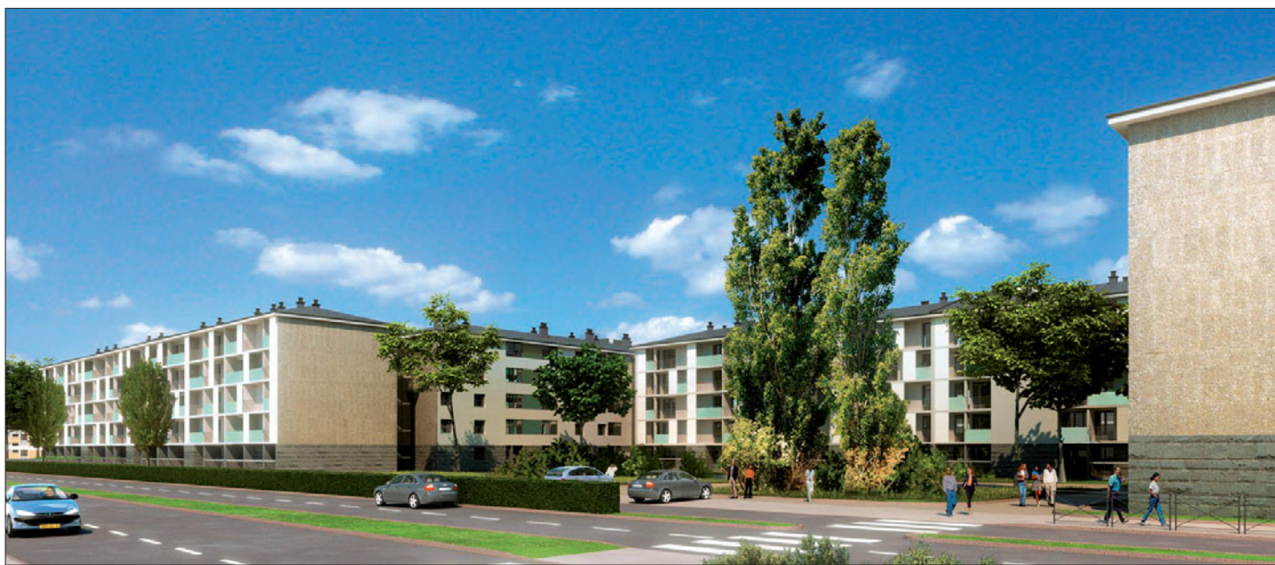
Cabri Habitat réhabilite ses logements de l'avenue Corneille (ci-dessus) mais aussi de la barre Camus.