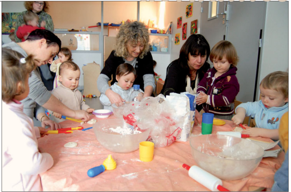
Des ateliers collectifs, une des activités du Relais Parents Assistantes Maternelles.

Horaires élargis. La bibliothèque du centre ville propose désormais des horaires élargis notamment le midi. Ils permettront à celles et ceux qui travaillent dans le secteur de profiter de leur pause pour se nourrir l'esprit en allant chercher un livre ou un DVD. Les usagers gagnent aussi une demi-heure les jours de marché. La bibliothèque est ouverte le mardi de 12h30 à 18h30 ; le mercredi de 10h à 12h30 et de 13h30 à 18h30 ; le jeudi de 13h30 à 18h30 (espace jeunesse à partir de 16h30), le vendredi de 13h30 à 18h30 ; le samedi de 10h à 12h30 et de 13h30 à 17h30. Rappelons également que les abonnements dans les bibliothèques (centre-ville, mais aussi Croix Saint-Lambert et Cesson) sont gratuits depuis un an pour les Briochins, ceux qui travaillent ou étudient à Saint-Brieuc. Cette politique vise à mettre la culture et la connaissance à la portée du plus grand nombre. Elle fait l'objet d'une large campagne de communication.