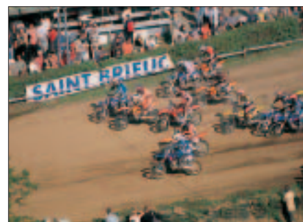
Motocross, dimanche 18 juin à Douvenant.

■ Motocross. La Vallée de Douvenant servira de cadre aux championnats de Bretagne, le dimanche 18 juin. Première manche qualificative à 10h. Reprise à 13h30. Deuxième édition des courses side-car. Organisation : Moto-club briochin 02 96 94 24 13.