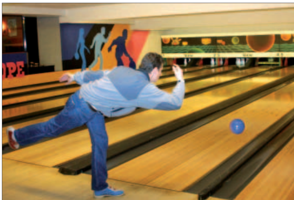
En mai et juin, la ville vous invite à découvrir et à pratiquer une multitude d'activités, parmi lesquelles le bowling. Ici au Cyclope, rue de Paris.