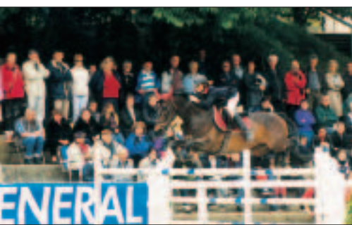
A la Pentecôte, le concours hippique attire toujours beaucoup de monde.

• Contact au centre équestre, 02 96 94 19 19.