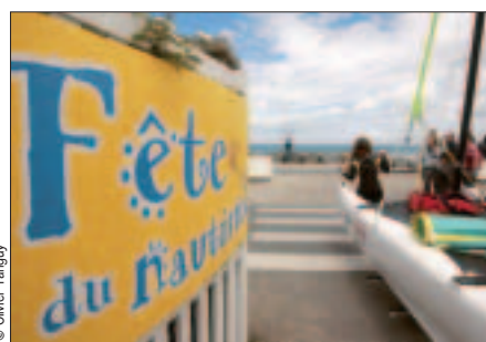
Rendez-vous les 13 et 14 mai aux Rosaires.

■ Fête du nautisme. Les 13 et 14 mai, la plage des Rosaires invite petits et grands, débutants ou confirmés à découvrir les multiples facettes du monde nautique, de la voile au kayak en passant par l'aviron. Ateliers d'initiation, baptêmes et animations sur place. Renseignements au 02 96 74 51 59 (Centre municipal de voile des Rosaires), 02 96 62 56 66 (Office du sport) ou 02 96 62 55 17 (service des sports de Saint-Brieuc).