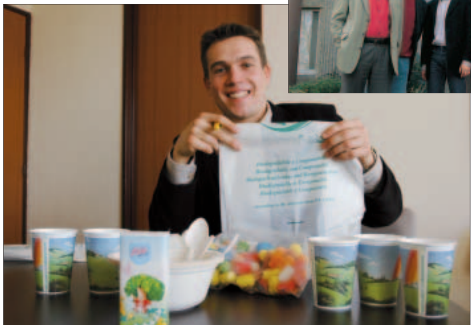
Des sacs et autres objets en plastique ? Non, à base d'amidon de maïs.

Terralies : « Il s'agit de montrer que l'agriculture ne se contente pas de nourrir. Elle est très pré-