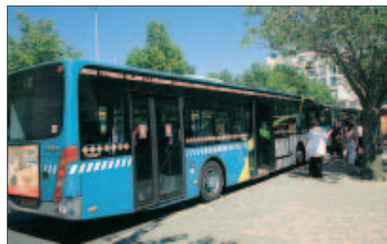
Les transports, une des compétences les plus connues de la Cabri à travers les TUBs.

• UNAFAM, section des Côtes d'Armor. Sur RV le 1 er lundi, le 2 e mercredi et le 3 e vendredi du mois à la Maison de l'UDAF, 28 Bd Hérault, 0296335384. www.unafam.org