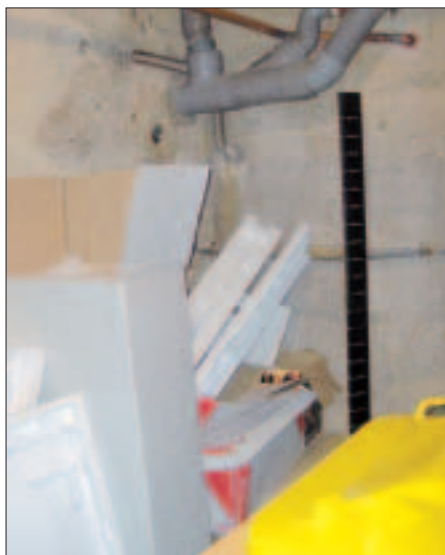
Les encombrants entreposés dans les locaux poubelles des collectifs, une mauvaise habitude.

33% : c'est le pourcentage de déchets mal triés dans les poubelles de l'agglomération. Il y a encore trop d'ampoules et néons avec les bocaux de verre (ils vont en déchèterie) ; trop de bouteilles d'huile et emballages souillés dans les conteneurs jaunes ; trop de déchets non triés et d'encombrants laissés dans les parties communes dans les collectifs. Ces défauts de tri anéantissent parfois les efforts réalisés par les autres citoyens, et ne permettent pas de limiter autant que possible le coût de traitement des ordures ménagères. La Cabri, en charge de la collecte, souhaite rectifier le tir et améliorer le tri. Elle lance une grande campagne de sensibilisation, sur deux années. Dans le «Cabri et vous», son magazine distribué en boîtes aux lettres, la communauté d'agglomération propose un questionnaire pour mieux connaître les habitudes des uns et des autres. Il favorisera également une première prise de conscience. D'autres documents, d'autres opérations suivront, pour que chacun puisse acquiescer les bons gestes. Pour que le traitement au final coûte moins cher ; pour que