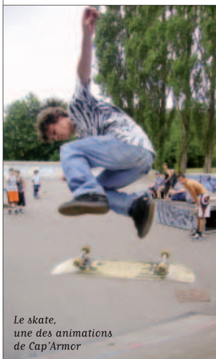
Le skate, une des animations de Cap'Armor

• Les inscriptions aux activités sont prises à partir de la mi-mai par le service des Sports de la mairie, 15 rue Vicairie, tél. 02 96 62 55 17.