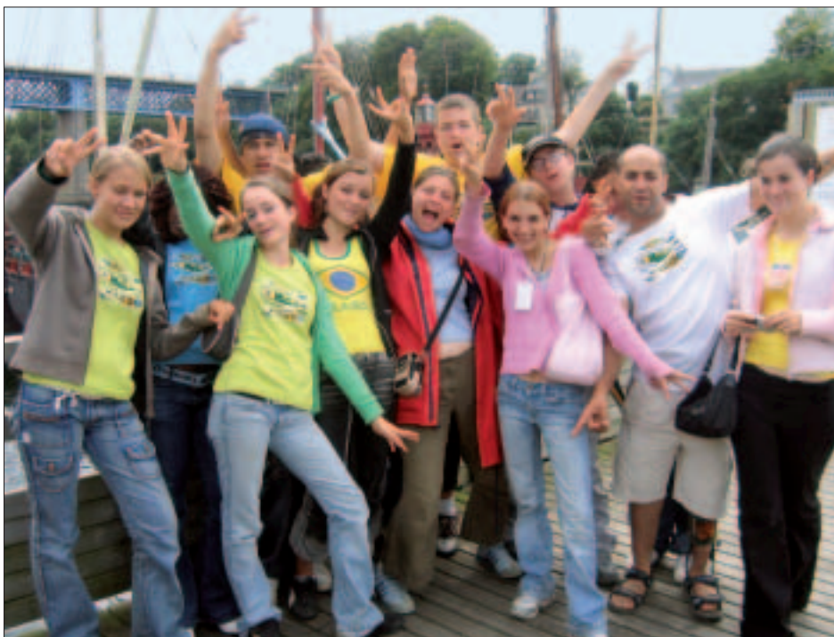
En 2005, des jeunes ont participé au festival de Douarnenez en bénévoles, gagnant ainsi leurs places pour les concerts.

En Bosnie, c'est la solidarité internationale qui est mise en avant chez les 15-17 ans, qui rénovent une école avec des agents municipaux. Les jeunes participeront au festival de l'Amitié, visiteront la Bosnie et rencontreront des ONG.