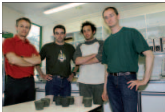
L'IUT travaille avec le CEVA, dans le cadre de Prolittoral, avec le soutien de l'ANVAR et du SGPU.