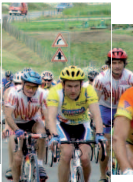
Une épreuve cyclosportive sur les routes d'entraînement du champion Bernard Hinault.