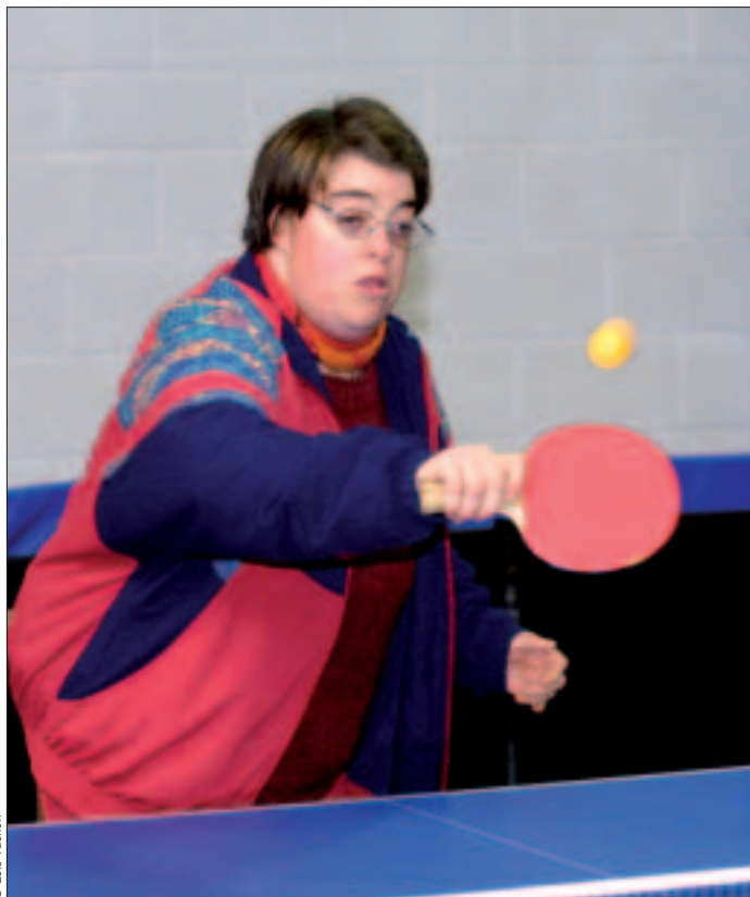
Le tennis de table, une des nombreuses activités proposées au gymnase Brizeux.

Quel que soit leur potentiel, les personnes peuvent ainsi partager leurs émotions et découvrir de nouvelles sensations. «Le sport permet d'acquérir et de développer ses capacités personnelles» qui dépassent