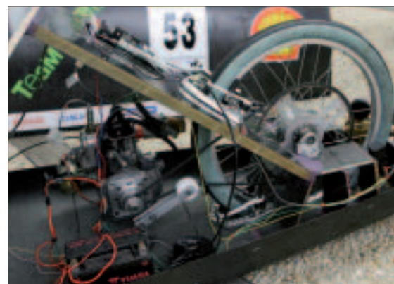
5 e en catégorie GPL, 78 e sur 250 au général, le petit bolide de l'IUT a tenu ses promesses.

la forme - des allures de bombe au ras du sol -, l'habitacle, le châssis, les matériaux composites, avant de passer au moule et à la fabrication. Plus de 1000 heures de travail au total. Les profs ne sont pas peu fiers du résultat : 38 kg contre 53 kg pour le précédent modèle, visibilité améliorée pour le pilote. Résultat : la voiture a fait 5 e en catégorie GPL, 78 e sur 250 au classement général en mai, sans entraînement faute de temps. Pour l'IUT, c'est un projet « high tech valorisant qui se concrétise, dans un établissement universitaire qui n'a pas les moyens d'une école d'ingénieurs ». Les enseignants rêvent désormais de construire un véhicule aux couleurs de l'IUT, pour le faire connaître davantage encore. ■