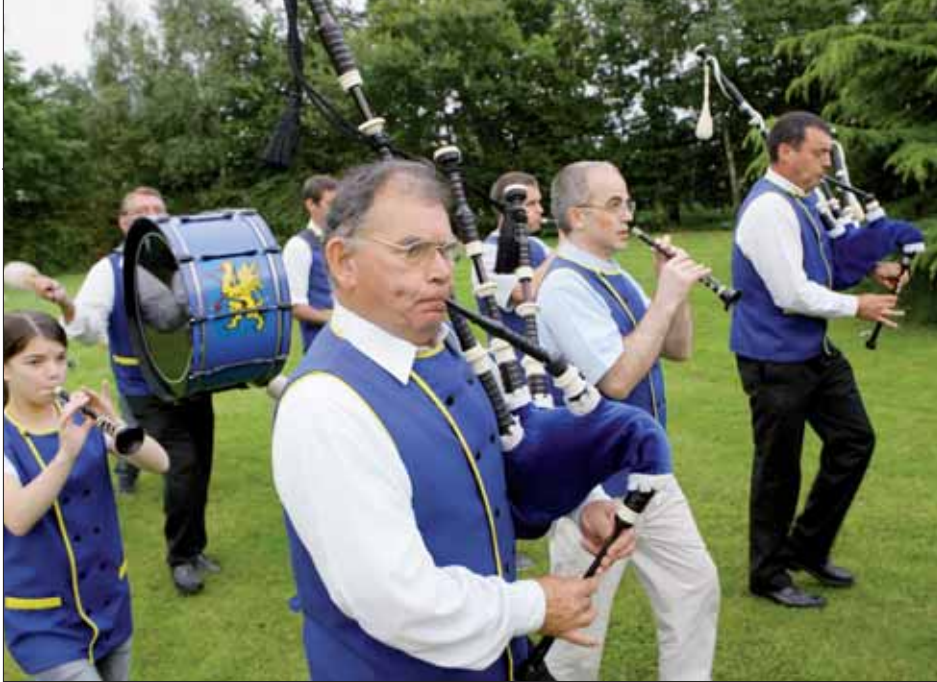
Le défilé sur les Champs fera connaître le Bagad... y compris à Saint-Brieuc.