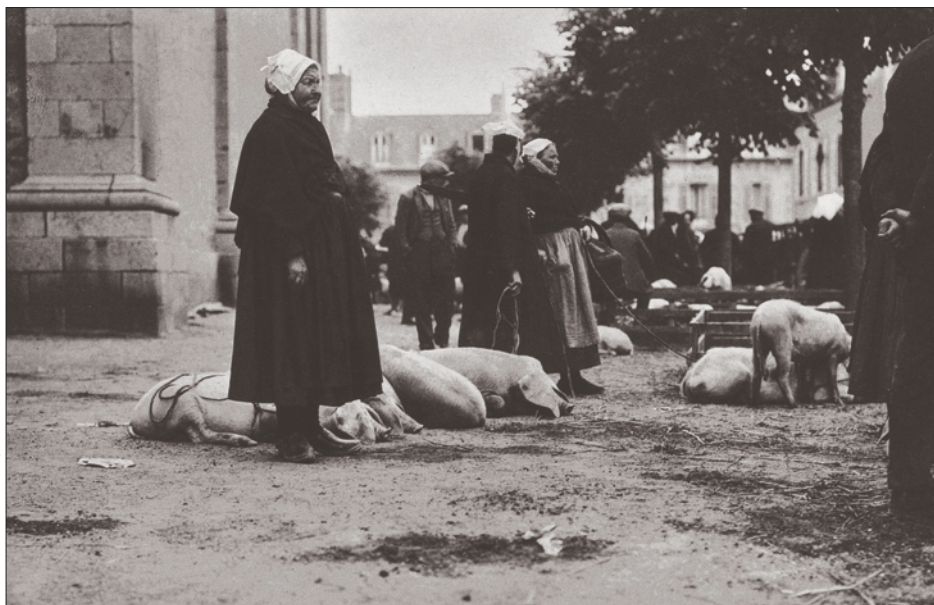
La Foire Saint-Michel retrouve son site d'origine, la place du même nom. A l'époque, on y vendait aussi ses cochons !

• Restauration dès le vendredi 28 septembre, foire jusqu'au dimanche 30 septembre. Foire aux puces le dimanche : dernières inscriptions prises début septembre, auprès de la Direction des affaires commerciales et du stationnement, 7 rue Poulain Corbion. 02 96 62 56 40.