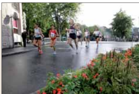
Les Foulées arpentent les quais du Légué.

■ Foulées briochines. En raison des travaux au centre-ville, les Foulées Briochines ont lieu sur les quais