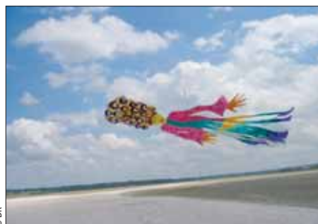
Des cerfs volants dans le ciel de la baie, une des réalisations des enfants.