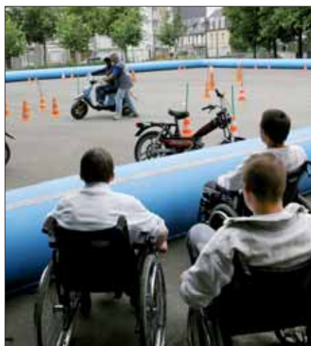
Alcool, drogue, vitesse, fatigue... ne prenez pas de risque.

La Ville et son service Jeunesse ont mené en juin une action de prévention routière rassemblant tous les acteurs : pompiers, gendarmerie, Police Sport Prévention, DDE, Association des Paralysés de France, Croix Rouge... A la veille des départs en vacances et des résultats d'exams, il s'agissait de sensibiliser le public, et les jeunes en particulier sur les dangers de la route. Quelques verres, du cannabis, vous perdez vos réflexes ; quelques kilomètres/heure et le choc peut s'avérer violent, la vitesse multiplie les risques... Des messages qui passaient dans les rues piétonnes, à travers des ateliers, des mises en situation et des chiffres. 39 % des accidents sont mortels. En Côtes d'Armor 19 % des accidents corporels sont liés à l'alcool ; les 18-24 ans représentent 25 % des décès sur la route ; les cyclomoteurs sont impliqués dans 20 % des accidents corporels.