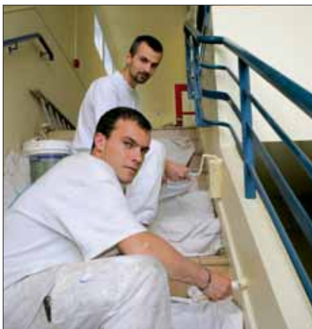
Des peintures ont été refaites à Hoche cet été, un chantier parmi d'autres.