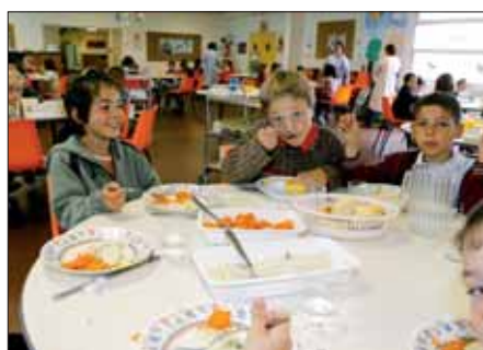
Des repas équilibrés mais aussi de nombreuses animations sur le temps de midi.

• Abonnements et carnets. Au service Éduca-