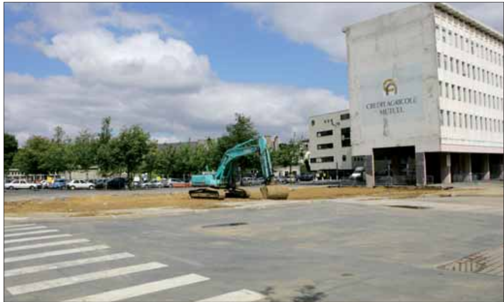
Un paysage qui change en centre-ville, avec la démolition de la barre et, dès octobre, la construction du centre commercial.

Le gros œuvre terminé, en octobre 2008, la Ville entame l'aménagement des abords : rues Saint-François et Sainte-Barbe, sous une forme semi-piétonne (dans le prolongement de la rue du Général Leclerc) ; puis 71 e RI, dont l'aménagement sera ensuite appelé à s'adapter pour la mise en place des voies réservées aux bus (transport en site propre) ; enfin la réalisation d'un jar-