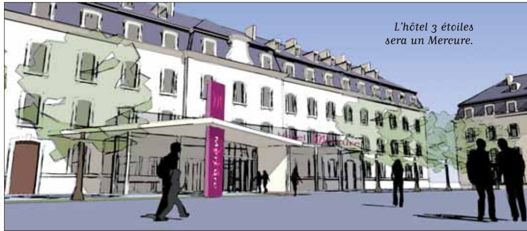
L'hôtel 3 étoiles sera un Mercure.