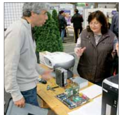
Le travail de l'ombre mis en lumière lors du forum.

Des menuisiers et des assistantes maternelles, des ingénieurs et des assistants sociaux, des agents qui assurent la propreté des rues et des jardiniers, des juristes et des agents état civil, des paveurs et des relieurs, des bibliothécaires et des policiers, des documentalistes et des animateurs, des serruriers... On ne pourra pas citer les 120 métiers représentés au sein des services municipaux, dans les nombreux domaines d'intervention de la mairie. 120 métiers et une somme de compétences accumulées par les 1200 agents municipaux. Le 26 juin dernier, un forum a été l'occasion pour eux d'échanger, de découvrir les opérations suivies par les uns et les autres, sur les différents sites, pour mieux valoriser une action commune.