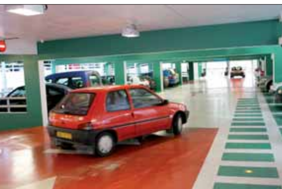
Il y a de la place notamment aux Promenades et à Gouédic. En prime, les professionnels vous offrent des tickets !

Le centre-ville et ses commerces restent accessibles pendant le chantier. L'Union du commerce entend l'animer plus que jamais. Elle a notamment imaginé, en partenariat avec la Ville, une action autour du stationnement : les professionnels - commerçants, professions libérales - ont la possibilité d'offrir du temps de stationnement à leurs clients. Les tickets qu'ils distribueront donnent droit à 1h aux Promenades, 1h18 à Poulain Corbion et Saint-Benoît, 1h21 sur l'esplanade Raoul Poupard (devant le commissariat) et 2h15 à Gouédic.