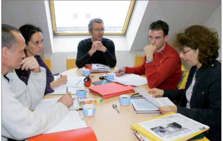
La Ville travaillera avec les partenaires présents auprès des jeunes, en complément, pour renforcer les actions menées.

Le dispositif s'adresse à des jeunes qui connaissent des fragilités, qui ne vont pas bien pour différentes raisons et risquent de décrocher. Il se mettra en place en étroit lien avec les familles. L'entrée dans le dispositif de Réussite Éducative leur sera proposée par les professionnels. L'équipe Réussite Éducative établira un diagnostic, identifiera les difficultés, et imaginera des