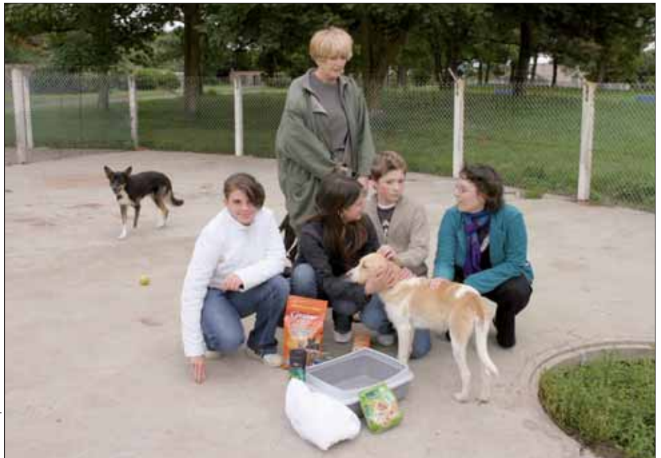
La première action consistait à organiser une collecte pour les animaux de la SPA : un déjeûn bien relevé.

D'autres projets sont en cours pour 2007-2008 au sein des différentes commissions du CJB : un concert des jeunes talents collégiens et lycéens avec la Citrouille ; une étude pour mieux connaître les attentes et les besoins des jeunes en situation de handicap ; des échanges avec Gabès en Tunisie. Toutes les bonnes volontés