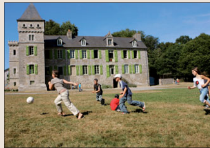
Été 2007 au centre municipal de La Sauldraie.

• Pratique. Pour en savoir plus sur l'histoire du port du Légué, se renseigner aux Archives municipales. Elles proposent un circuit patrimoine à la découverte du port. Archives municipales, 3 bis rue Bel Orient.