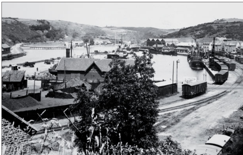
La gare ferroviaire du Légué et les bâtiments témoignant de l'activité commerciale du port.

De 1808 à 1811, les eaux du Gouet voyaient surtout passer des bateaux de commerce. Le port importait de la pierre à chaux, du plâtre, du bois, des sabots et du fer ; il exportait des beurres, des graisses, du chanvre et des grains. « Après l'installation de la gare, l'arrivée au port du chemin de fer (en 1887) et la construction d'un premier bassin à flot, les armateurs délaissèrent la grande pêche à Terre-neuve, pour se reconverter dans le commerce maritime et l'industrie », explique Yolaine Coutentin. En 1913,