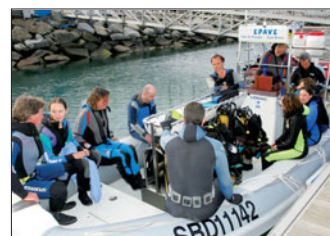
La plongée, une des activités de Décllic Form'

• Décllic Form' , du 5 mai au 29 juin, inscriptions à partir de début avril au service municipal des Sports, 15 rue Vicairie, 02 96 62 55 17. ■