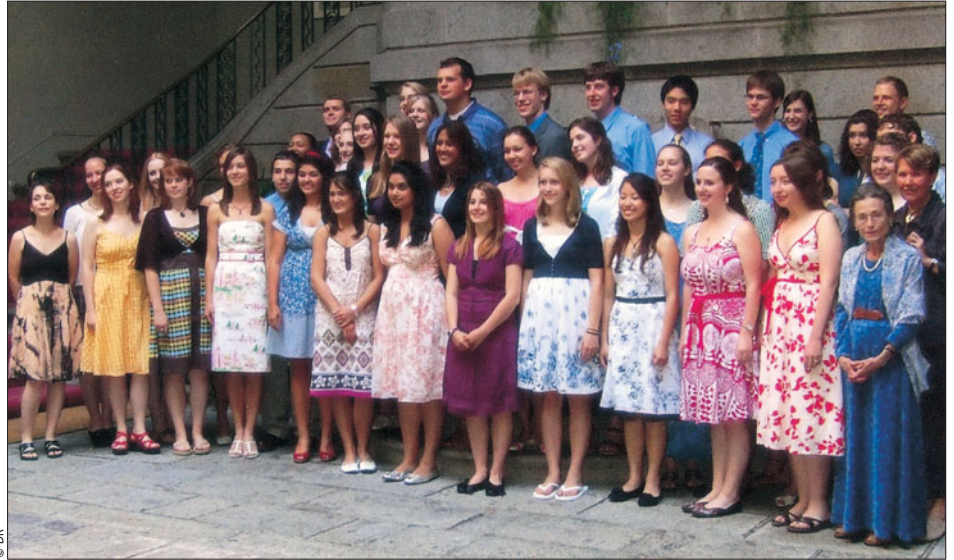
Lors de la réception en mairie, un moment toujours important pour les jeunes.