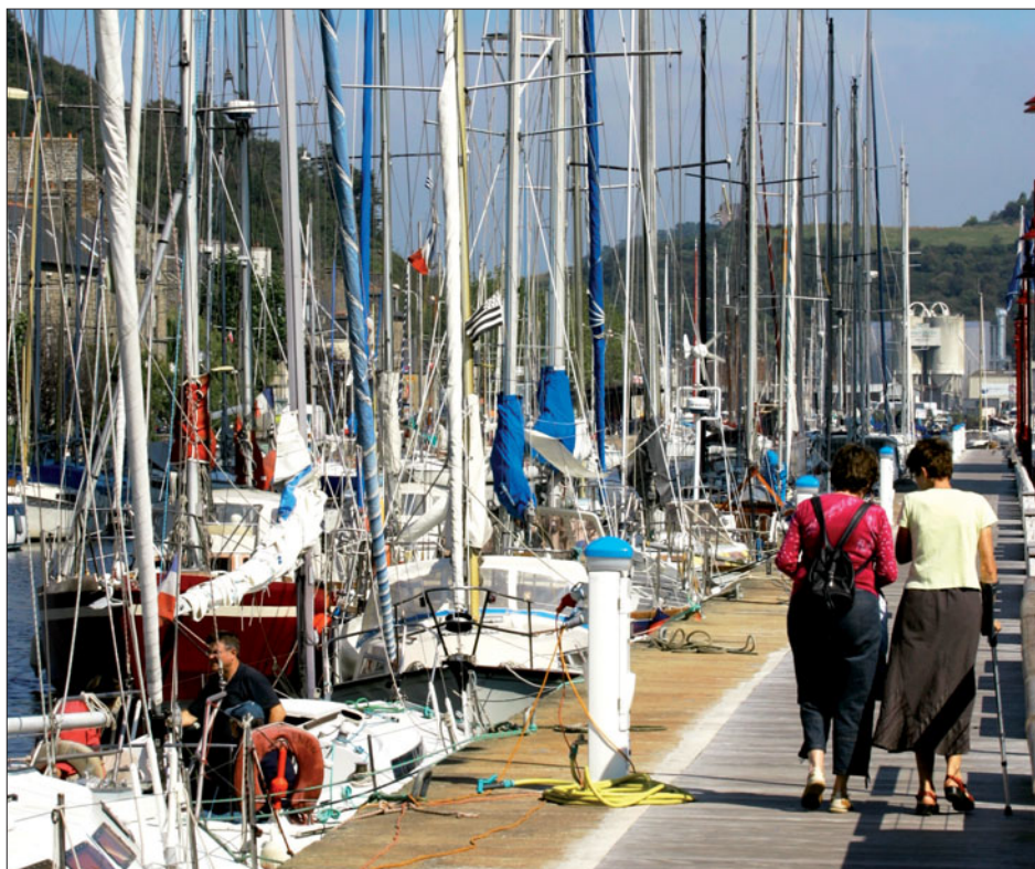
La promenade le long des quais s'avère vraiment plaisante.

Les plaisanciers ont d'ores et déjà adopté le Légué, un port bien abrité, dont ils apprécient la qualité des équipements et de l'accueil, mais aussi les efforts en matière d'environnement. Le port offre désormais «230 places à flot et 150 à sec ; une centaine de places à sec supplémen-