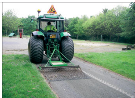
Les agents briochins ont conçu et fabriqué cette binette autotractée.