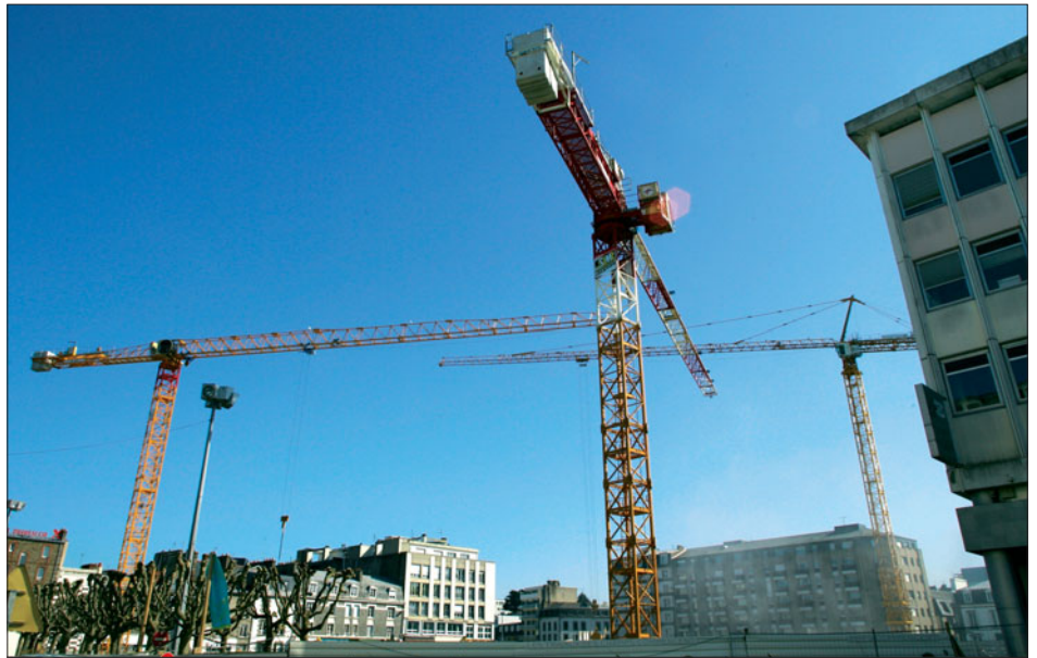
60 000 m 3 de terre évacués lors du terrassement, et désormais des grues pour réaliser le gros œuvre.