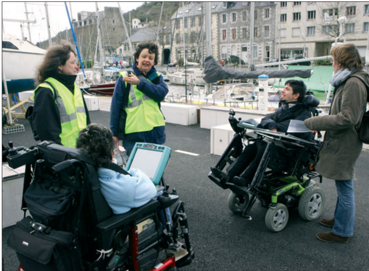
Après une première visite rue Bel Orient, les Archives ont emmené les jeunes du centre hélio-marin au Légué.