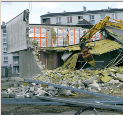
L'ancienne salle est démolie pour laisser place à une construction neuve.

Cette scène pourra accueillir les groupes locaux accompagnés par La Citrouille, mais aussi une programmation de musiques actuelles tout au long de l'année, et constituera un lieu de diffusion supplémentaire pour les festivals briochins.