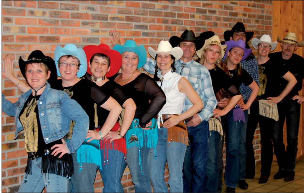
L'association Color Hats proposera des démonstrations et initiations.

La preuve ? Color Hats proposera, outre ses