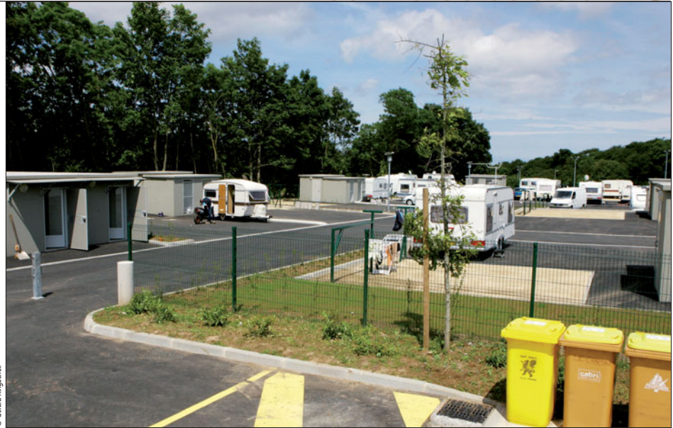
14 emplacements pouvant accueillir 28 caravanes sont aménagés rue Chaptal.